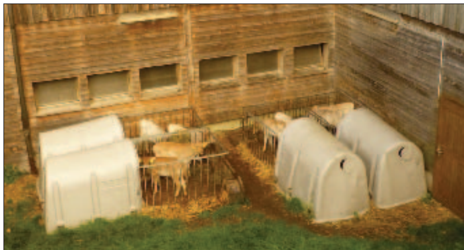
Venkovní odchov telat dojníc v boudách zlepšuje zdravotní stav stáda

Záchrana života mláďat má však přednost i před pravidly ekologického zemědělství. Pokud nelze pro záchranu života mláďete zajistit mateřské nebo vhodné přírodní mléko, použije chovatel mléčnou krmnou náhražku. Učiní o tom záznam a na mládě se od konce podávání mléčné náhražky vztahuje zkrácené přechodné období podle tabulky č. 4.