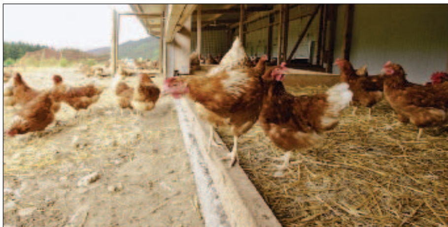
Ekologický chov nosnic

Chov drůbeže se neobejde bez pevných nebo mobilních stájí (minimální plochy!). Předepsány jsou zatravněné výběhy. Aby se drůbež mohla zdržovat venku i v nepříznivých povětrnostních podmínkách, osvědčily se v praxi ekologického chovu drůbeže ještě „zastřešené výběhy pro špatné počasí“. Ty jsou přičleněny přímo k drůbežárně a zpravidla představují 1/3 její plochy. Je v nich podestýlka, případně i napajedla a místa pro příjem krmiva. Zpevněním části výběhu, vytvořením přechodné zóny od zpevněného k „zelenému“ výběhu s nastlanou kůrou apod., která se před každým novým osazením drůbežárny vymění a promyšleným umístěním drůbeže do výběhů je možné omezit i případný nadměrný přísun dusíku na zatravněných plochách výběhu. Zvláštní význam mají tato opatření i pro ochranu proti parazitům. Dodržení potřebných odpočinkových dob pro zelené výběhy lze docílit vhodnou rotací. S mobilními drůbežárnami, u kterých se okol-