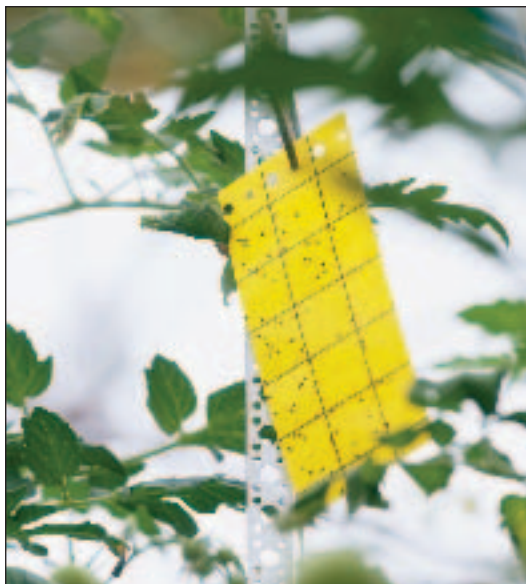
Lepová deska, Foto: EC – organic agriculture

Pomocné prostředky na ochranu rostlin a bioagens používané k ochraně rostlin mohou být používány v EZ, je-li pomocným prostředkem látka přírodního původu. Bioagens je prostředek na ochranu rostlin obsahující makroorganismy povahy živých parazitů, parazitoidů nebo predátorů mimo obratlovce, ve formě výrobku poskytovaného uživateli k použití proti škodlivým organismům na rostlinách nebo rostlinných produktech.