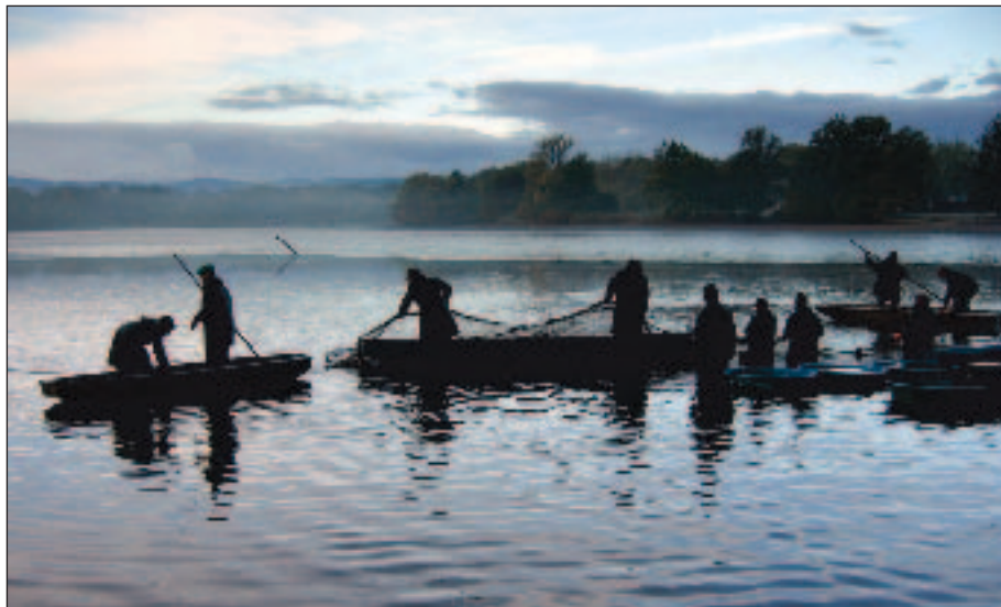
Výlov rybníka v jižních Čechách