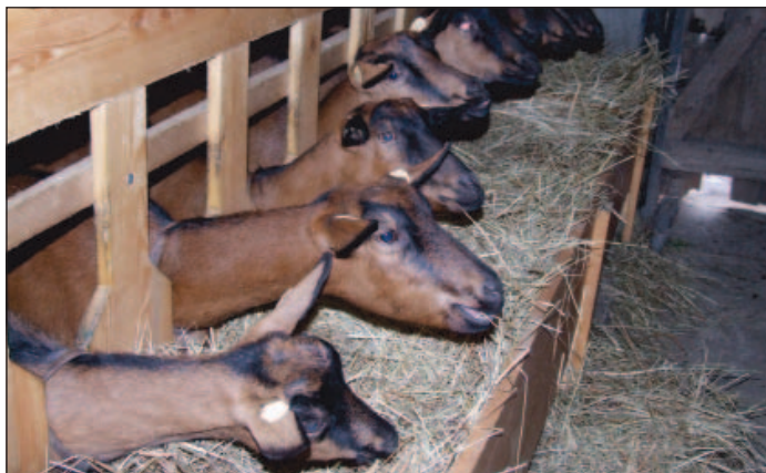
Objemná krmiva jsou základem krmné dávky přežvýkavců

Při krmení prasat a drůbeže je do 31. 12. 2017 možné omezeně použít ve výživě zvířat i konvenční krmiva zemědělského původu, v množství do 5% roční krmné dávky. Podmínkou bylo prokázat nedostupnost použitých konvenčních krmiv z ekologické produkce kontrolnímu orgánu a uchovat si osvědčení o nedostupnosti krmiv z ekologické produkce.