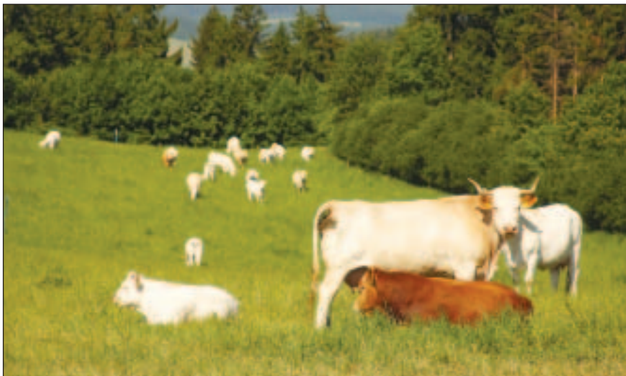
Pohoda v ekologickém chovu krav bez tržní produkce mléka