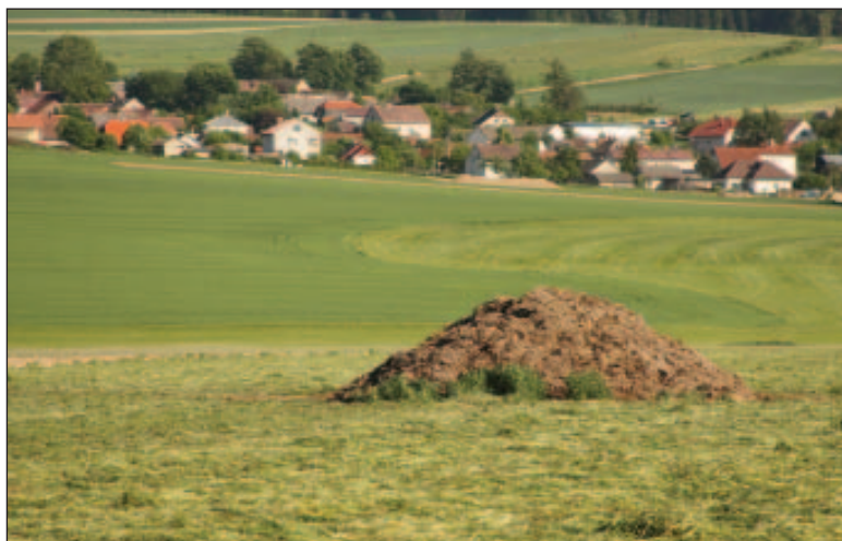
Polní hnojiště

ÚKZÚZ vede registr hnojiv, kde je uvedeno, která hnojiva jsou povolena pro EZ v ČR ( www.ukzuz.cz (přesměrováno na www.eagri.cz ).