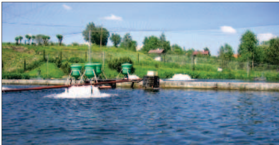
Otevřený průtočný systém chovu lososovitých ryb v ČR

Chovné systémy musí být realizovány a provozovány tak, aby bylo minimalizováno riziko úniku živočichů do okolního prostředí. Po eventuálním úniku živočichů musí být přijata opatření k omezení dopadů na ekosystém.