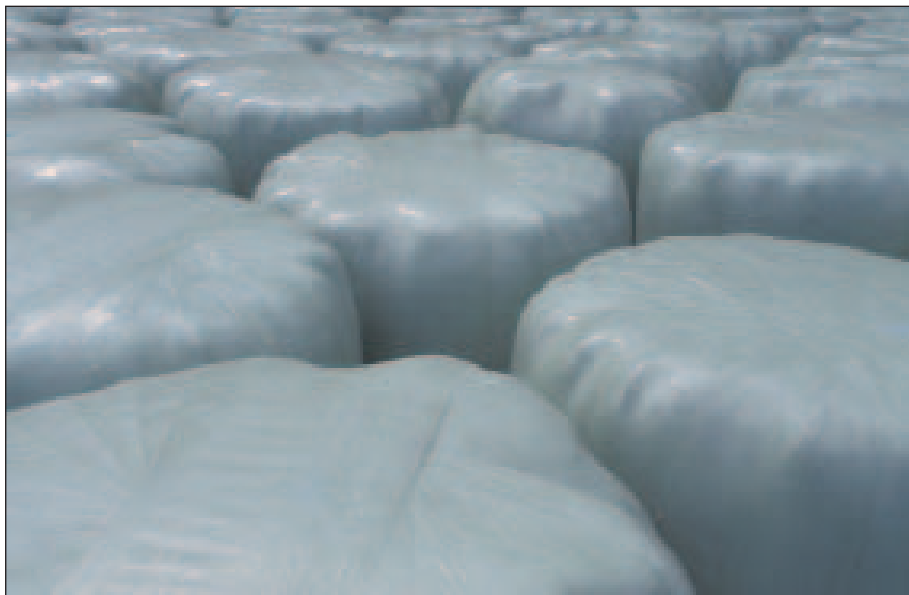
Dnes velmi častý způsob balení siláže a senáže

Konzervanty, které se použijí v EZ (platí to i o ostatních pomocných látkách), nemusejí být certifikovány pro možné použití v EZ. Pokud látka splňuje podmínky v příloze VI, tak se může jako konzervant použít, ale je třeba dávat pozor, aby ve složení nebyla ještě jiná nepovolená látka, případně zda nebyl přípravek vyroben za použití GMO. K dispozici jsou i konzervanty přímo certifikované pro použití v EZ.