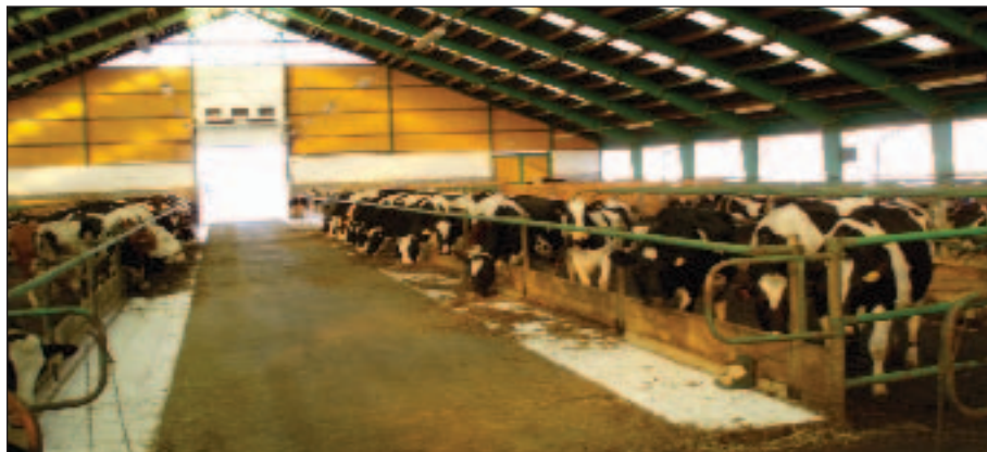
Vzdušné volné stáje – vhodná technologie pro ekologický chov dojníc

U všech nemocí musí být prioritou uzdravení zvířete. O výběru léčebné metody rozhodují koneckonců i znalosti terapeutů.