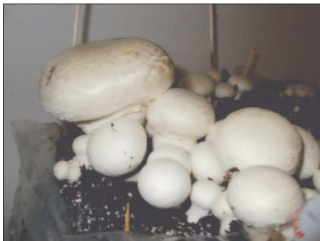
Pěstování žampionů na substrátu

Poznámka: Pokud nejsou chlévský hnůj a ostatní statková hnojiva z EZ k dispozici, mohou být využita i konvenční statková hnojiva (ne z průmyslových chovů) až do 25 % hmotnosti všech složek substrátu.