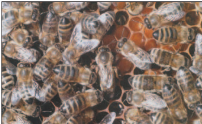
Včelí matka na plástu