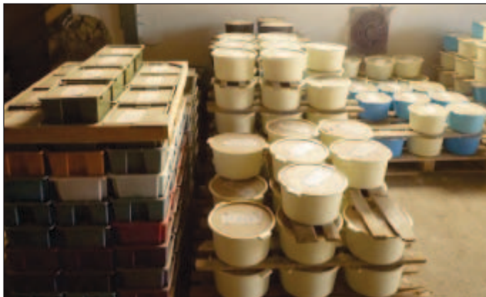
Minerální lízy ve výrobě

Antibiotika, kokcidiostatika a jiná léčiva, látky pro podporu růstu a jiné látky k zvyšování užitkovosti, se ve výživě zvířat nesmí používat.