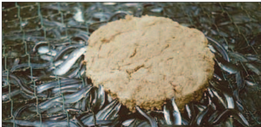
Odkrm juvenilů úhoře říčního polovlhlkou krmnou směsí v Itálii

Příslušný orgán může retroaktivně uznat za součást přechodného období již uplynulou a zdokumentovanou dobu, ve které nebyly v zařízení aplikovány v ekologické produkci nepovolené produkty.