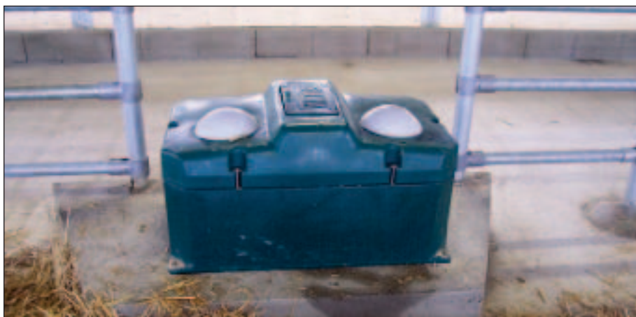
Míčová napáječka zabraňuje zamrznutí vody a je vhodná i do venkovního prostředí