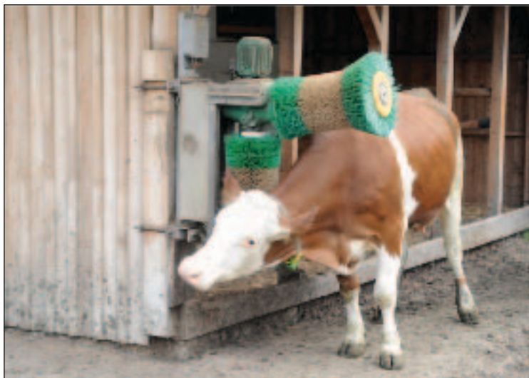
Welfare – drbadlo pro skot

Má-li si udržet fyzickou zdatnost , nesmí metody šlechtění, krmění, ustájení ani žádné umělé manipulace narušovat jeho schopnost prožít život bez utrpení, způsobeného fyzickými problémy, jako je chronická bolest, hlad nebo vyčerpání.